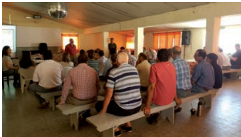
Taller de presentación y discusión de resultados finales en La Casilla (Flores).