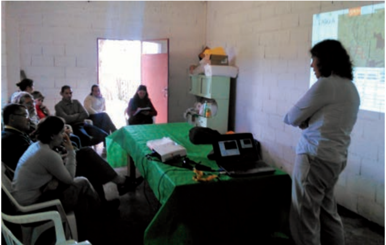
Taller de definición de predio de referencia: Velázquez.

Una vez elegidos los predios, se procedió a la instalación de parcelas para la medición de parámetros ambientales y productivos en potreros seleccionados, y analizar los resultados económicos a través de visitas y entrevistas a los productores, con apoyo de los técnicos locales.