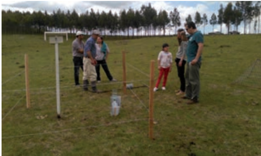
Vista del proceso de instalación del set de instrumental meteorológico, casilla meteorológica con sensor de temperatura del aire y globo negro.