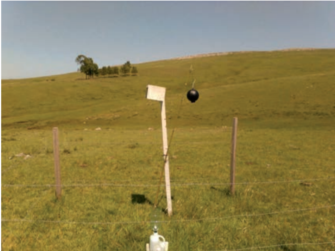
Vista panorámica del set de instrumental meteorológico instalado bajo monte y fuera de monte (casilla meteorológica, globo negro y pluviómetro).