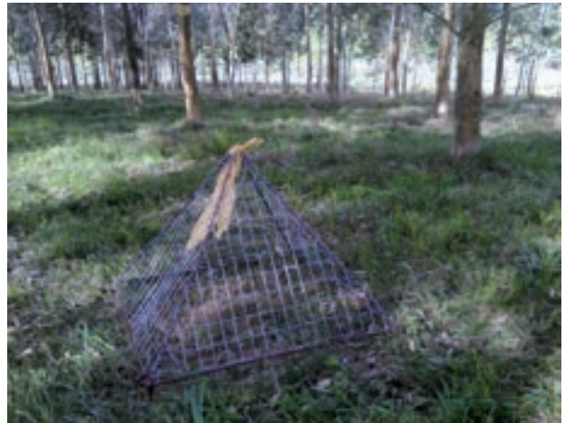
Jaulas de exclusión de pastoreo, instaladas para medir la tasa de crecimiento y calidad de las pasturas a campo abierto (izquierda) y bajo monte (derecha) en predio ubicado en Velázquez (Rocha).