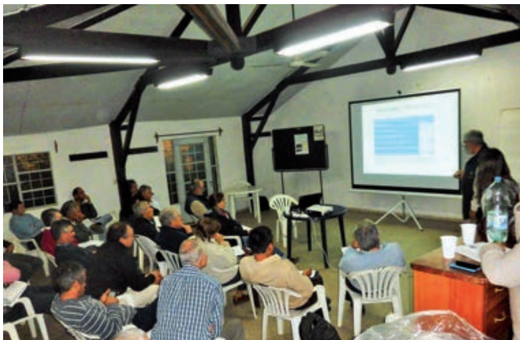
Taller de presentación y discusión de resultados parciales en Flores.

Una vez que se recabaron y procesaron los primeros resultados obtenidos a nivel de campo, se organizaron nuevos talleres zonales para su presentación y discusión, en los cuales participaron productores, dirigentes de organizaciones, técnicos, prensa, y público interesado en la temática. La información de campo se compartió con los productores, en un trabajo de taller en el cual se tomaron en cuenta sus comentarios, sugerencias y aportes. La difusión y convocatoria se hizo por las vías de comunicación de las instituciones organizadoras, y la prensa local y nacional.