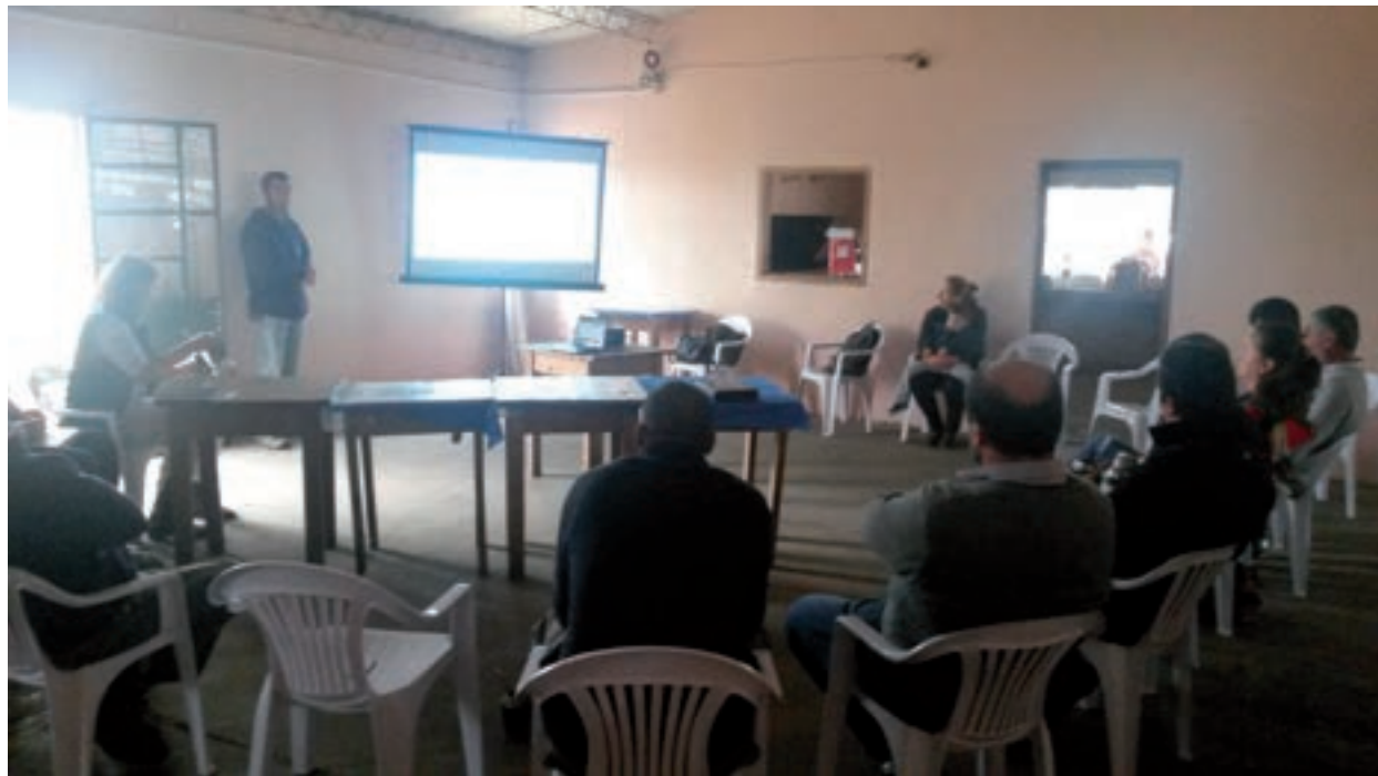
Taller de Planificación en Mariscal (Lavalleja).

Allí los participantes realizaron ajustes a la propuesta original que presentó el equipo del proyecto, y se conformó un listado de 9 productores interesados en participar de las diferentes etapas del mismo, que incluye la realización de entrevistas y visitas para caracterizar los sistemas productivos, documentar la percepción de los productores y sus técnicos asesores sobre los impactos de la incorporación de los montes, y para la instalación de parcelas de medición a campo en un predio por cada localidad (3 predios de referencia en total).