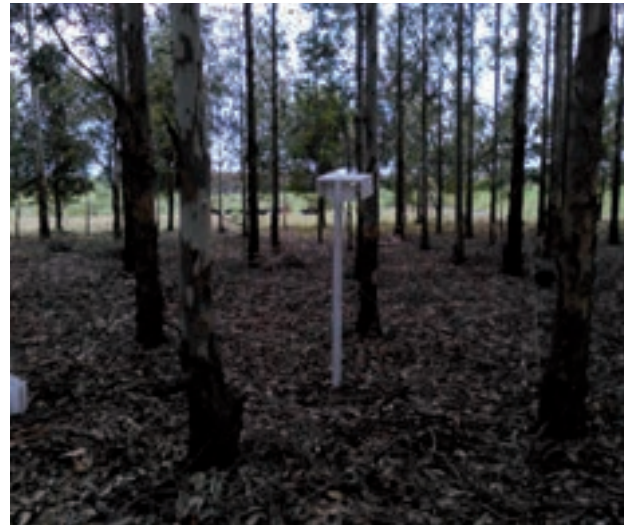
Parcela de medición de variables meteorológicas a campo abierto (izquierda) y bajo monte (derecha) en predio ubicado en Gruta del Palacio (Flores).