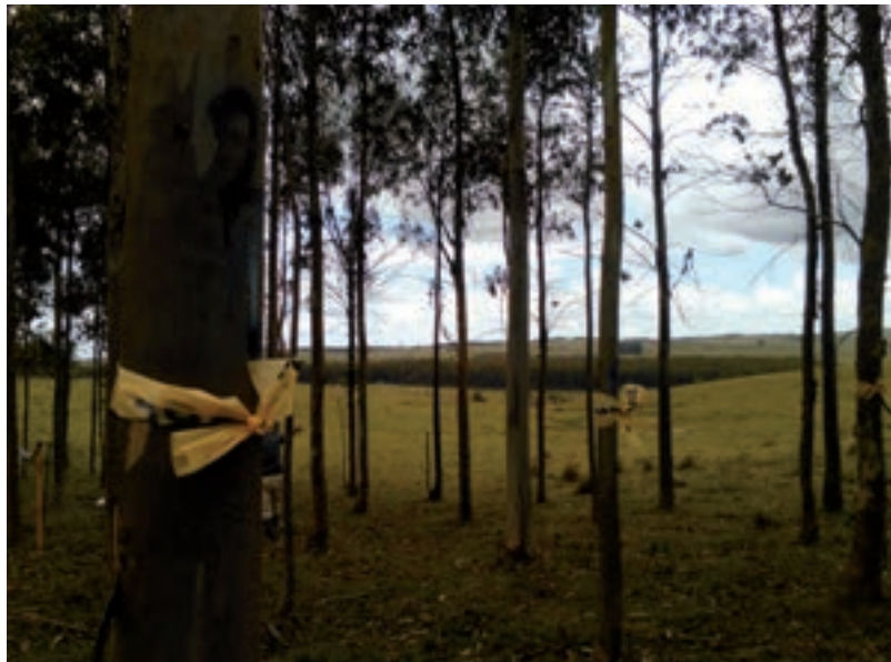
Parcela definida para la medición de la tasa de crecimiento y producción de madera en monte de cortina instalado en predio de Mariscal (Lavalleja).