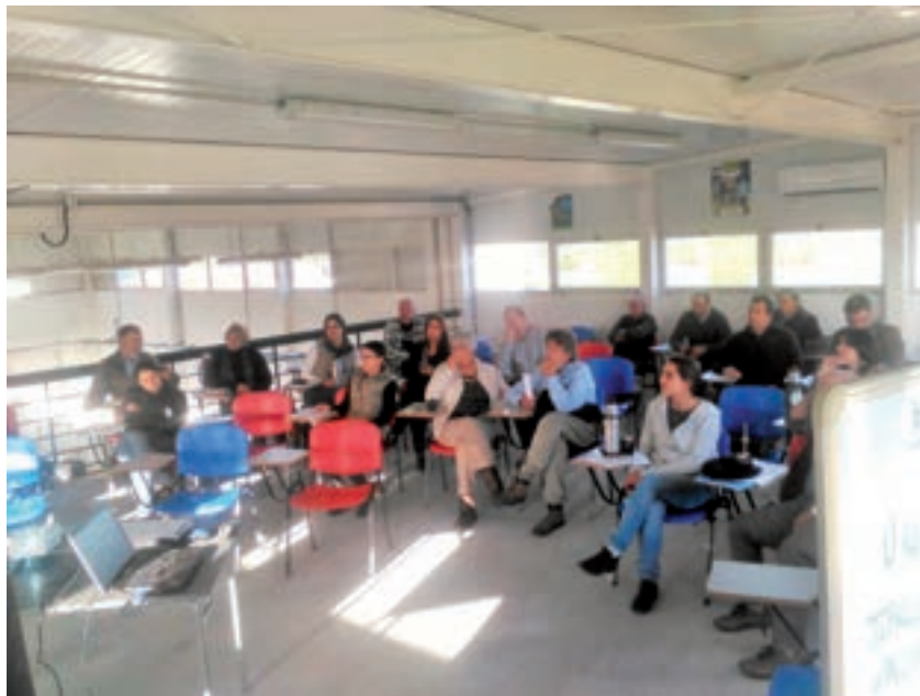
Taller de presentación y discusión de resultados finales en CRC (Aiguá, Maldonado).