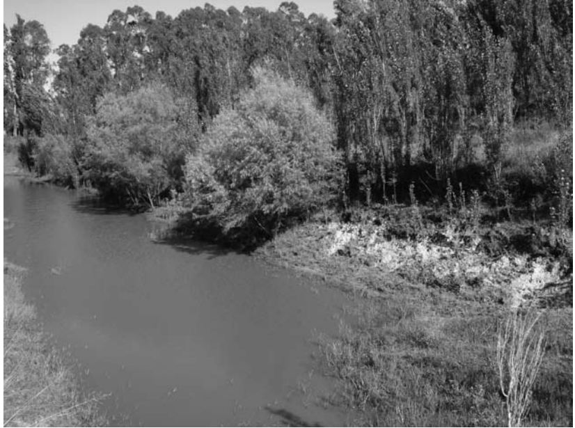
La vegetación en los bordes de las aguadas, un aspecto fundamental para la conservación