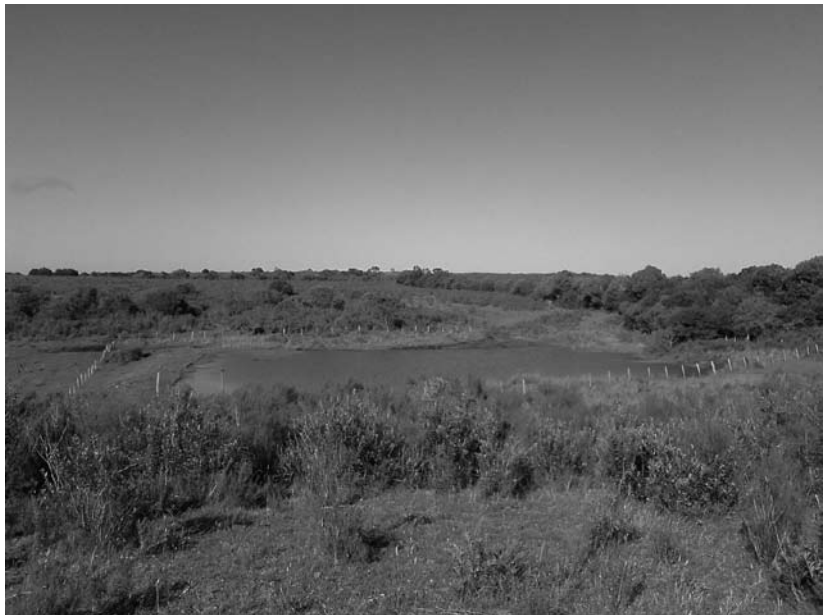
El modelo valora positivamente los tajamares cercados para disponer de agua de calidad y la conservación de la biodiversidad local