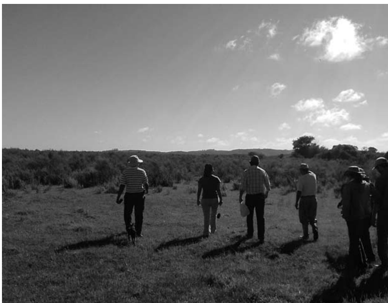
Jornada técnica de campo para puesta en práctica de la evaluación, Rivera