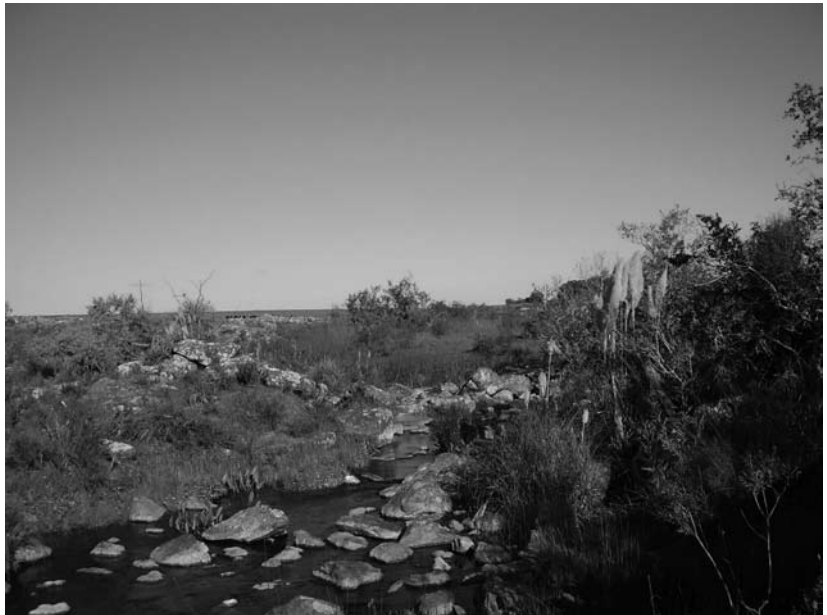
Las aguadas naturales, un valioso recurso de la región muchas veces desatendido en nuestros sistemas agropecuarios