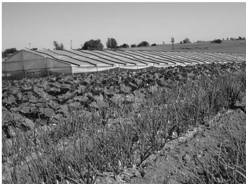
La diversidad productiva es valorada positivamente por EIAR