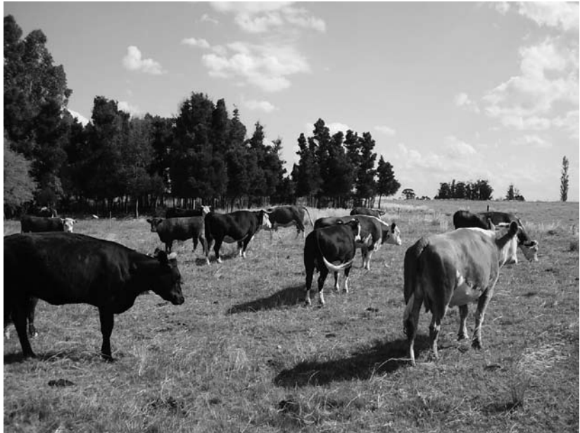
El bienestar animal y la producción, dos caras de una misma moneda